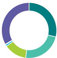
Répartition de l'actif (%)