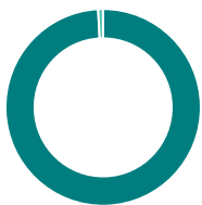
Répartition de l'actif (%)