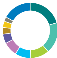
Répartition géographique (%)