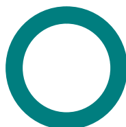
Répartition géographique (%)